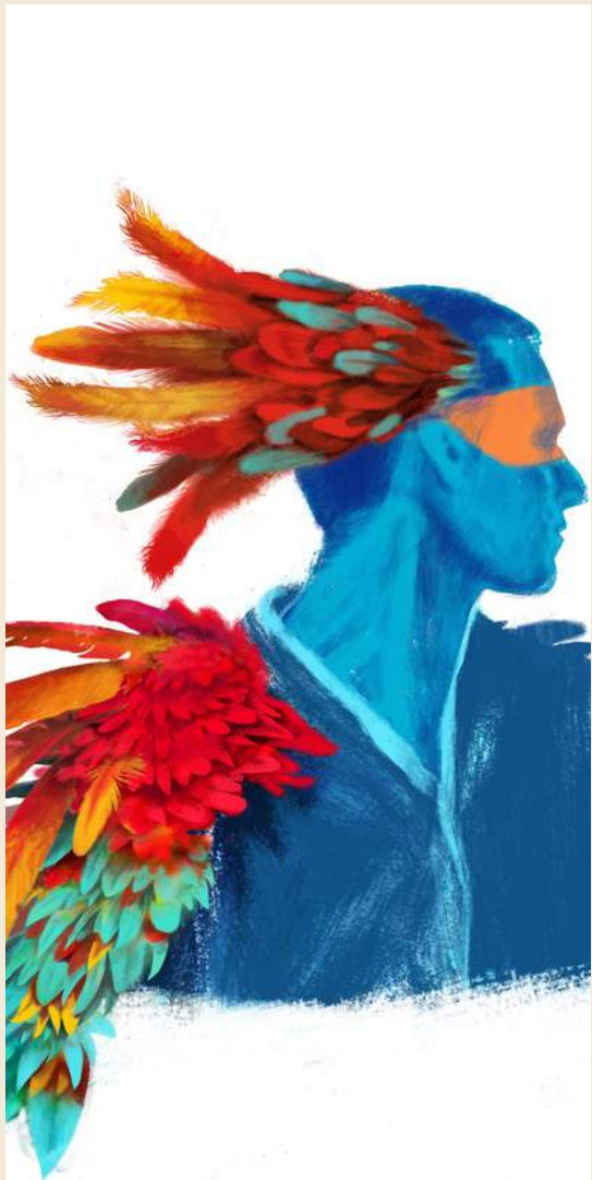
--> ailes oiseaux (sur tête) --> épaulettes en plumes --> costume non genré / tissus neutre (bleu,gris?) / coupe mixte