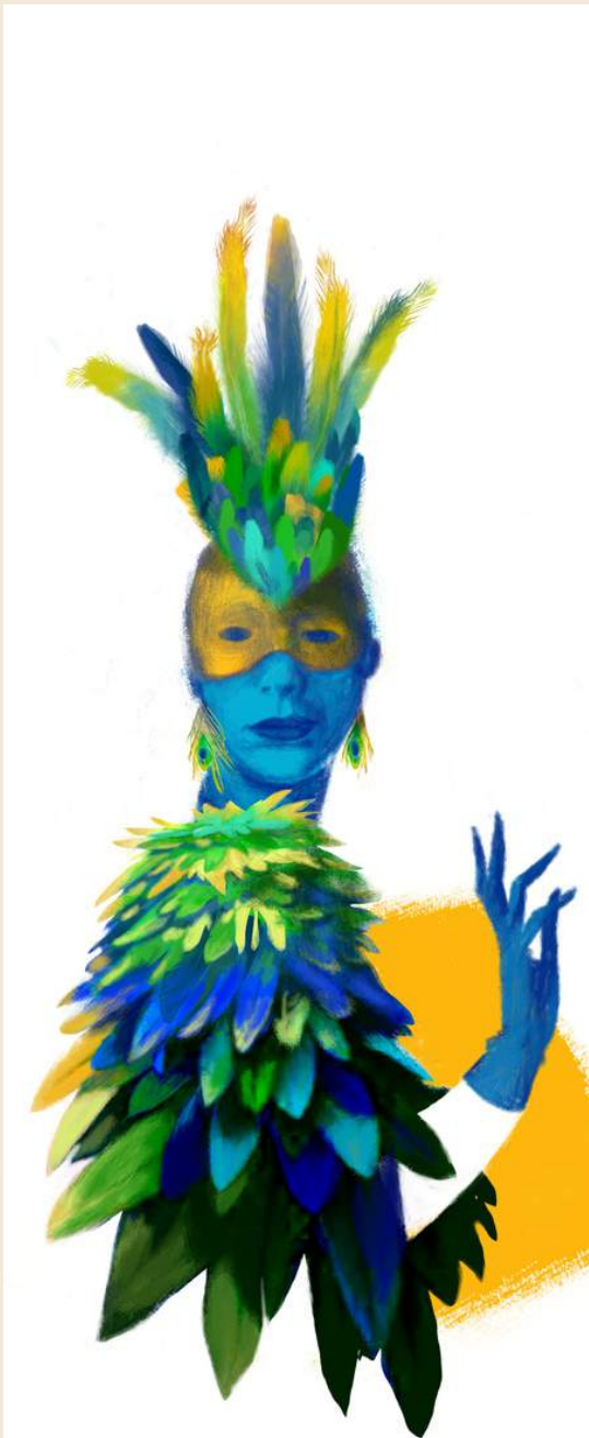
--> épaulettes en plumes --> maquillage type loup --> crête en plume