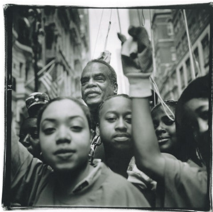
Edouard Glissant en 1997